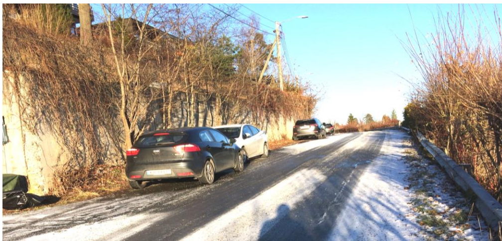
Foto: Vettrelia sett mot nord. Hjulsporene viser at bilene kjører i de samme sporene i begge retninger.

For å bruke undergangen ved Skytterveien må man gå Vettrelia mellom Krillåsveien og Skytterveien. Vettrelia er ca. 360 m lang uten fortau. På en lang strekning er det forstøtningsmur langs vestsiden av veien. Langs østsiden er det grunnnet topografien rekkverk (guard rail). Inntil muren er det som oftest mange parkerte biler. Der det står parkerte biler kan ikke to kjøretøyer passere hverandre.