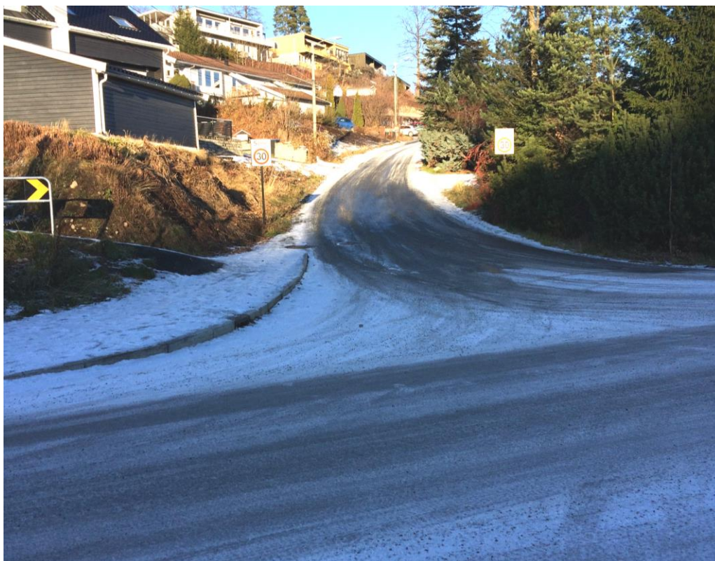
Foto: Skytterveien, Vettrelia sett mot nord. Bemerker høyresvingen mot Vettrelia og manglende fri sikt.

Ved enden av Vettrelia må skolebarna krysse Skytterveien. På veier uten fortau er man opplært til å gå langs venstre veikant. Når man kommer ned mot Skytterveien må barna derfor først krysse Vettrelia og så Skytterveien. Dette er en ugunstig og trafikkfarlig løsning. Biler som kommer fra Slemmestadveien og skal opp Vettrelia har ikke tilstrekkelig fri sikt til å unngå mulige konflikter med gående. Kryssingen av Skytterveien er heller ikke god for skolebarna. For skolebarn fra 6-år og oppover anses derfor Vettrelia med den nåværende utformingen trafikkfarlig som skolevei.